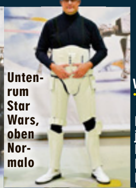
Untenrum Star Wars , oben Normalo