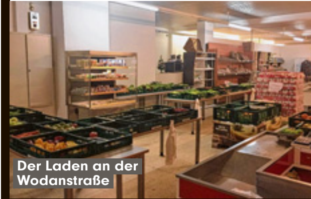
Der Laden an der Wodanstraße