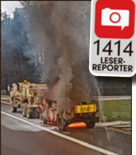
Das Militärfahrzeug fackelt direkt neben der Autobahn ab. Die wurde kurz darauf gesperrt